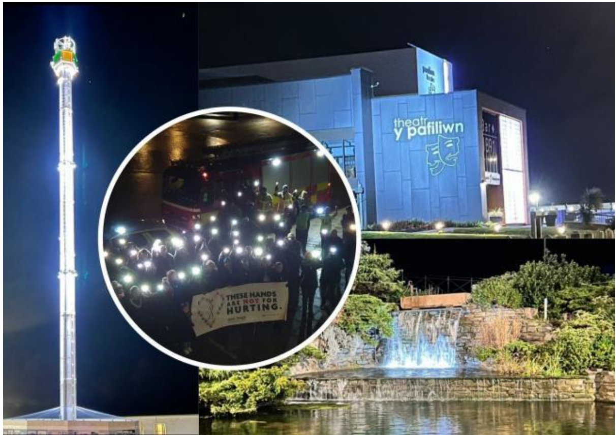
Photograph shows the landmarks and the Vigil held 25 th November 2021